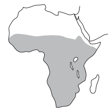
Hábitat del elefante